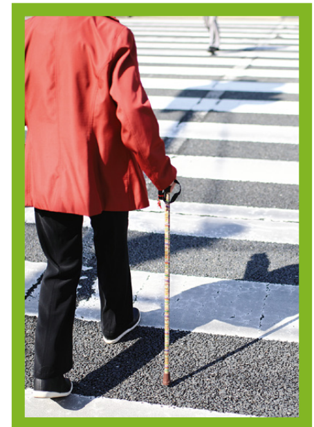
Sichere Querungsmöglichkeiten schaffen!