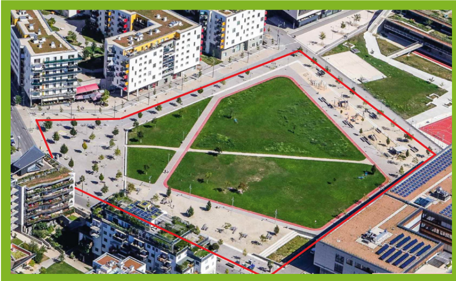
Hannah Arendt Park: Die Fläche innerhalb der roten Linien ist als Park gewidmet.