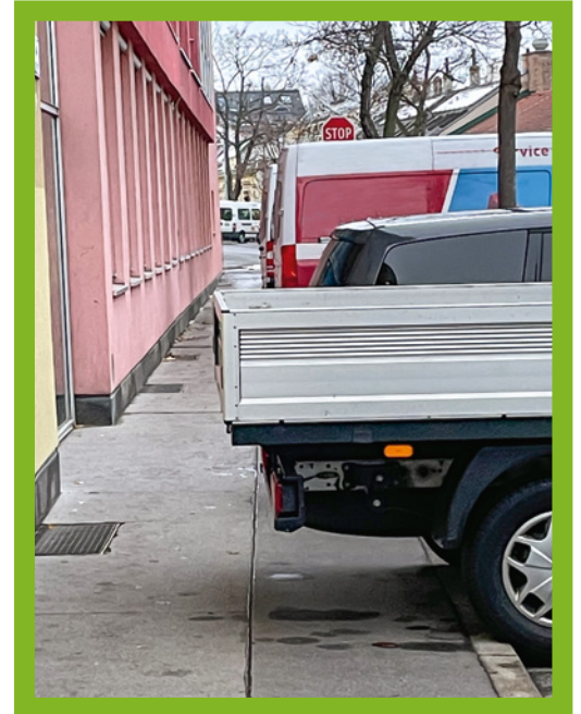
Vor der VS Konstanziagasse