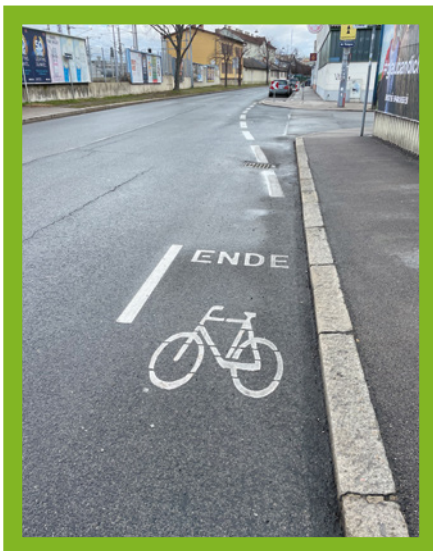
Willkommen in Stadlau

Wien hat ein Hauptradverkehrsnetz mit übergeordneten Verbindungen (Basisnetz), bezirksverbindenden Achsen (Grundnetz) und bezirksinternen Verbindungen (Erweitertes Grundnetz). Seit 2003 werden die übergeordneten Verbindungen über ein zentrales