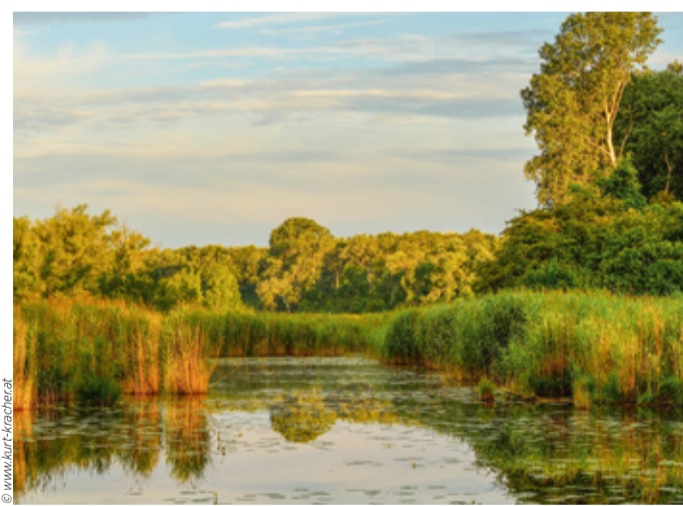
Nationalpark Donau-Auen, bei Groß-Enzersdorf, Eberschüttwasser

Selbst das Abschalten der alten Sperrbrunnen läßt seit ewig auf sich warten. Diese sicherten die Altlast des Tan-