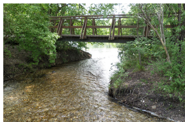
Esslinger Furt „nachher“