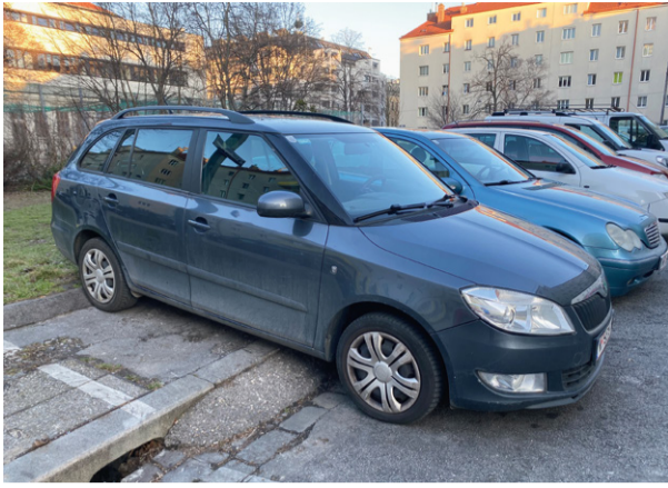
Kein Platz für Fußgänger*innen