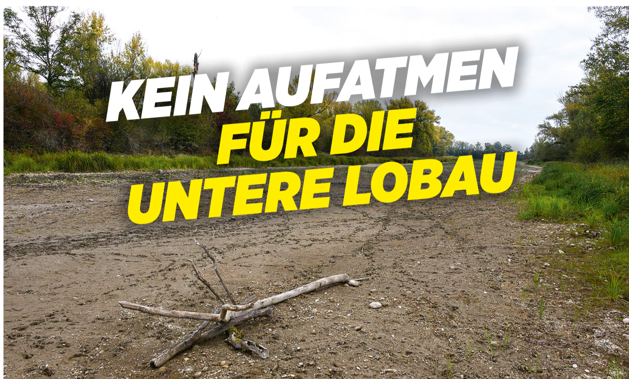
Die Untere Lobau verlandet.