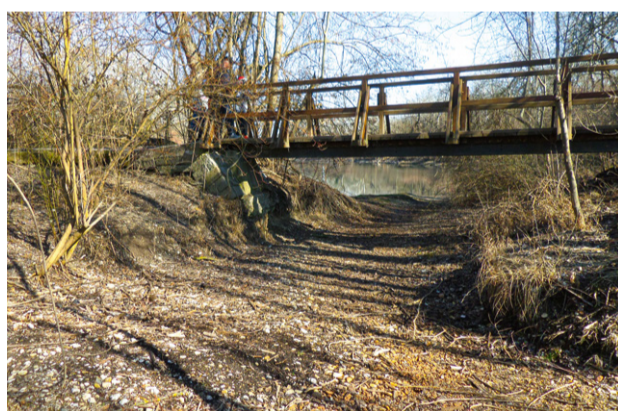
Esslinger Furt „vorher“